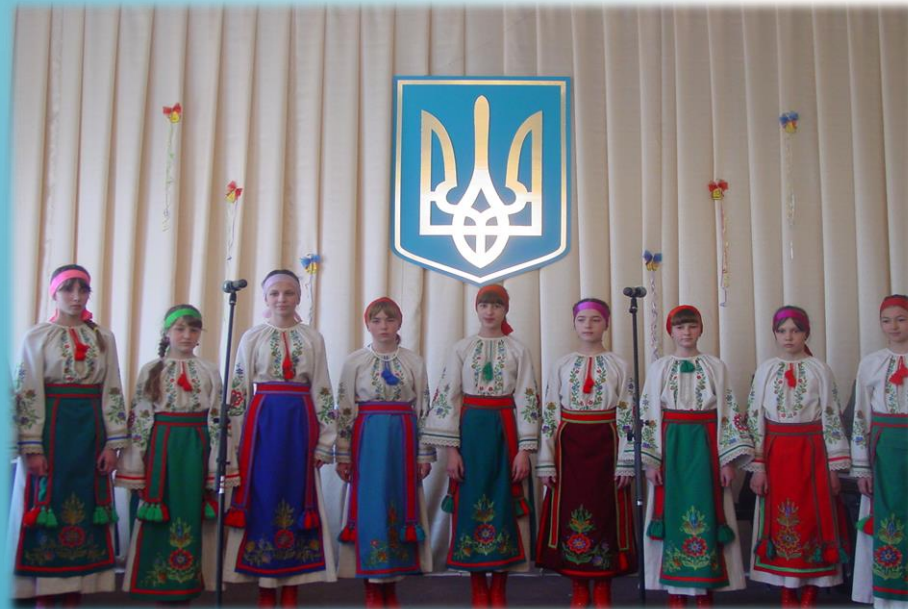
Вокальний дитячий ансамбль «Росинка»